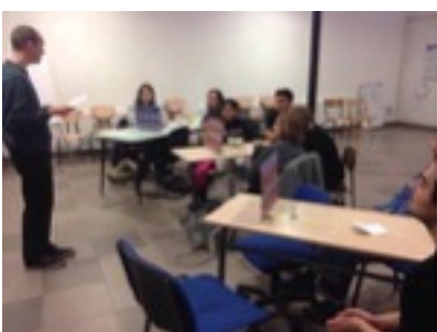
Sudestan - Novembre 2017