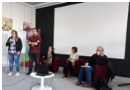
Conférence Volontourisme - Janvier 2018