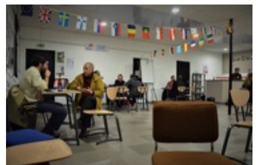
Speed-dating Témoignage - Janvier 2018