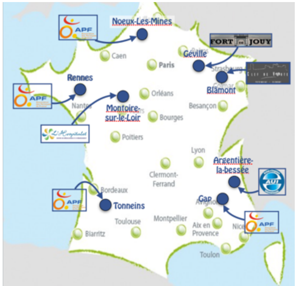
Carte prévisionnelle des chantiers Français sur 2017