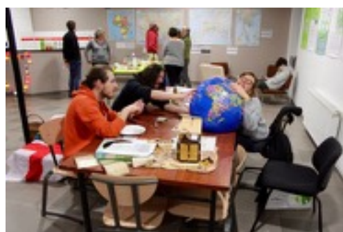
Globe Trotter - Mars 2016