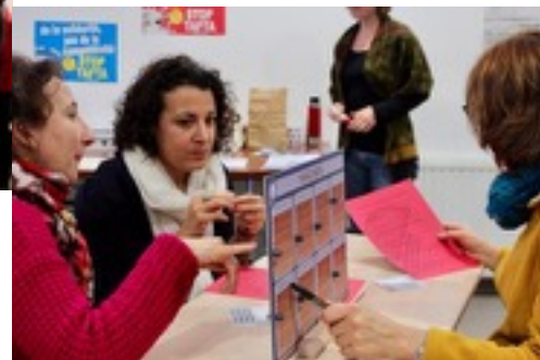
Sudestan - Novembre 2016